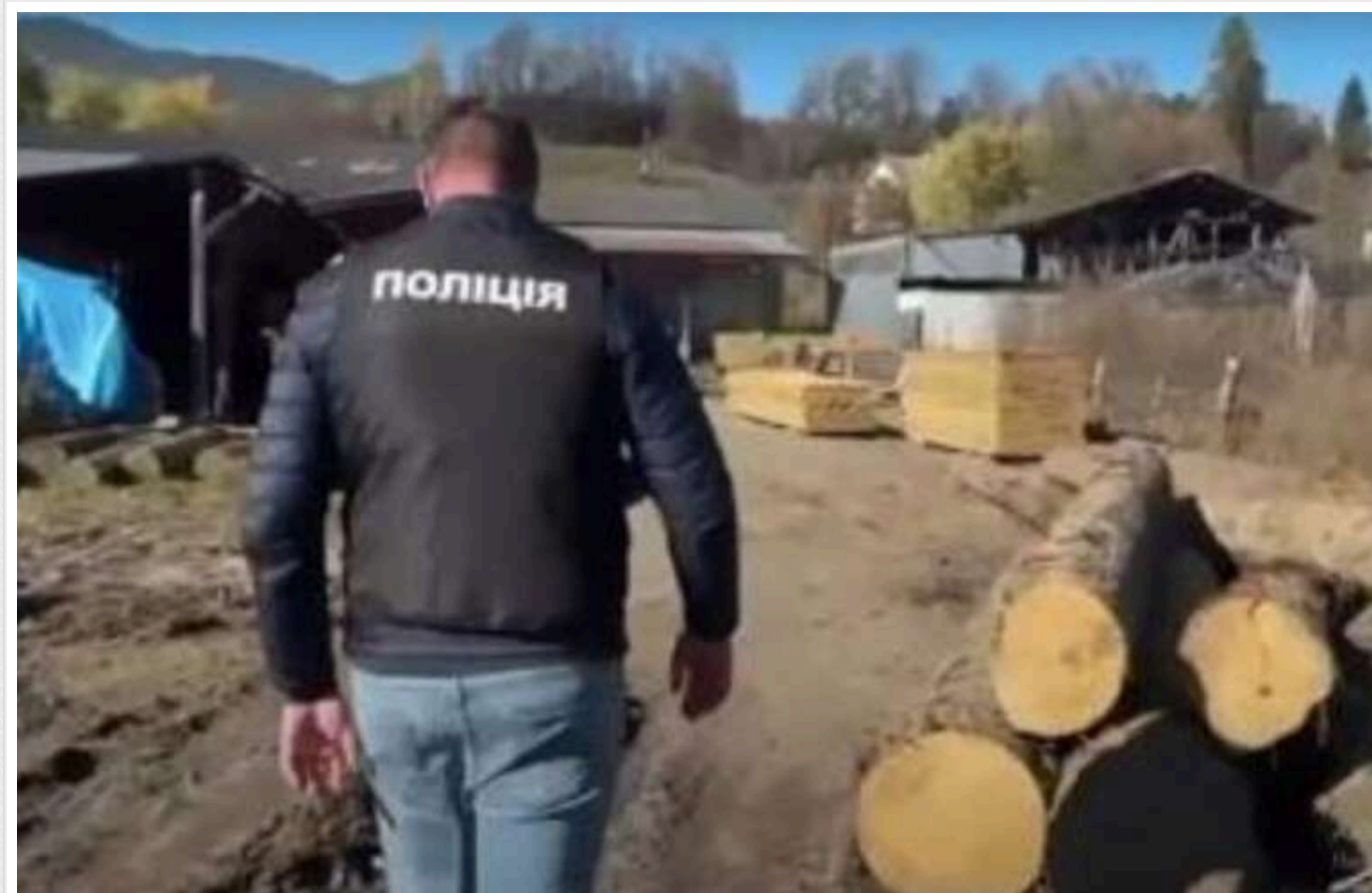
Поліція виявила банду «чорних лісорубів», яка вирубила ліс на 40 мільйонів

Аби затримати правоохоронців, зловмисники розклали на гірських дорогах «їжаки» і зруйнували мости.