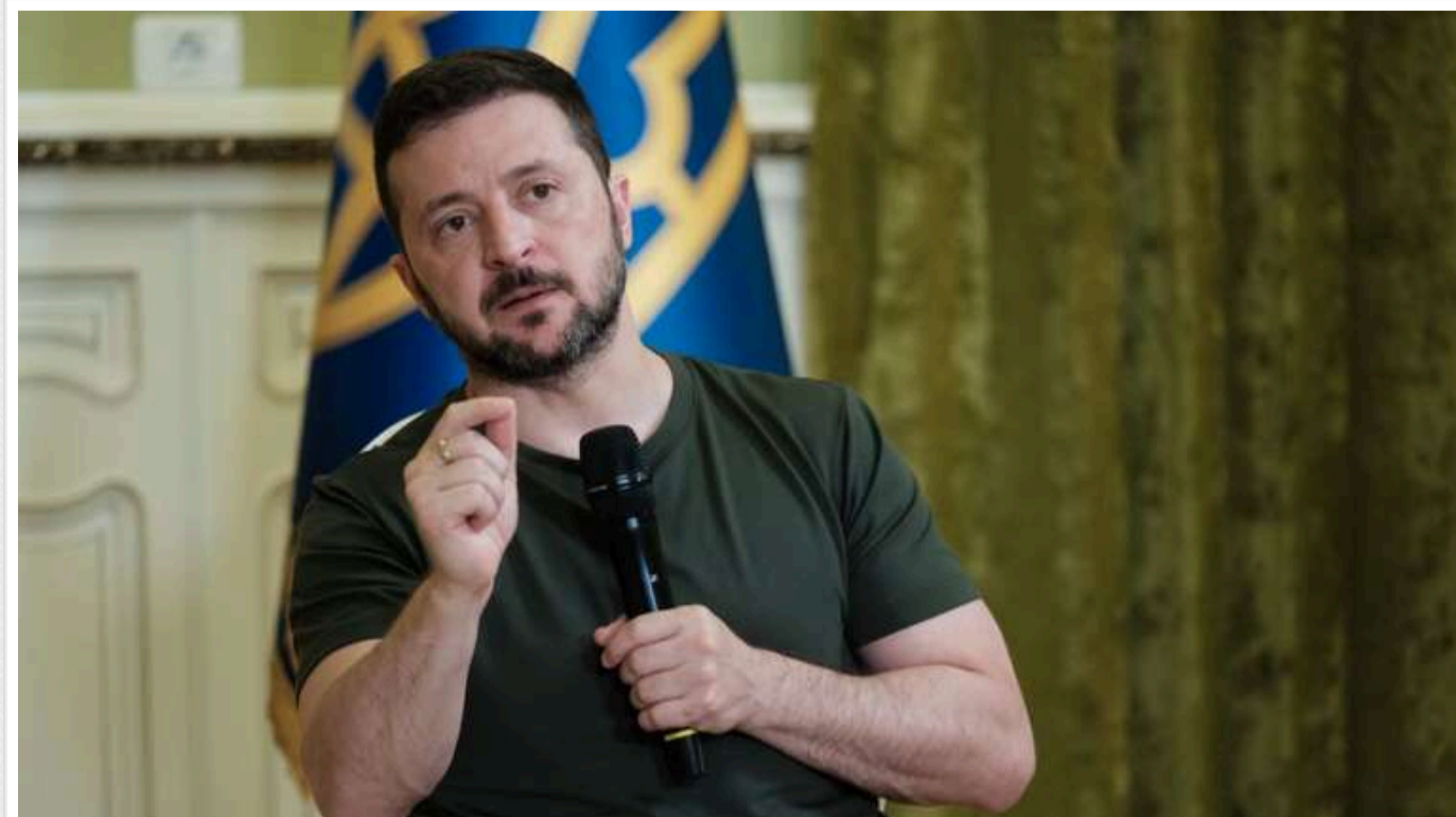
Зеленський звернувся до Південної Кореї із закликом бути підготовленими до викликів і активно брати участь у вирішенні питань, пов'язаних із війною в Україні

Президент Володимир Зеленський звернувся із закликом до Південної Кореї не залишатися осторонь війни РФ проти України. За його словами, Сеул має заручитися підтримкою союзників і не залишатися наодинці проти Москви та Пхеньяна.