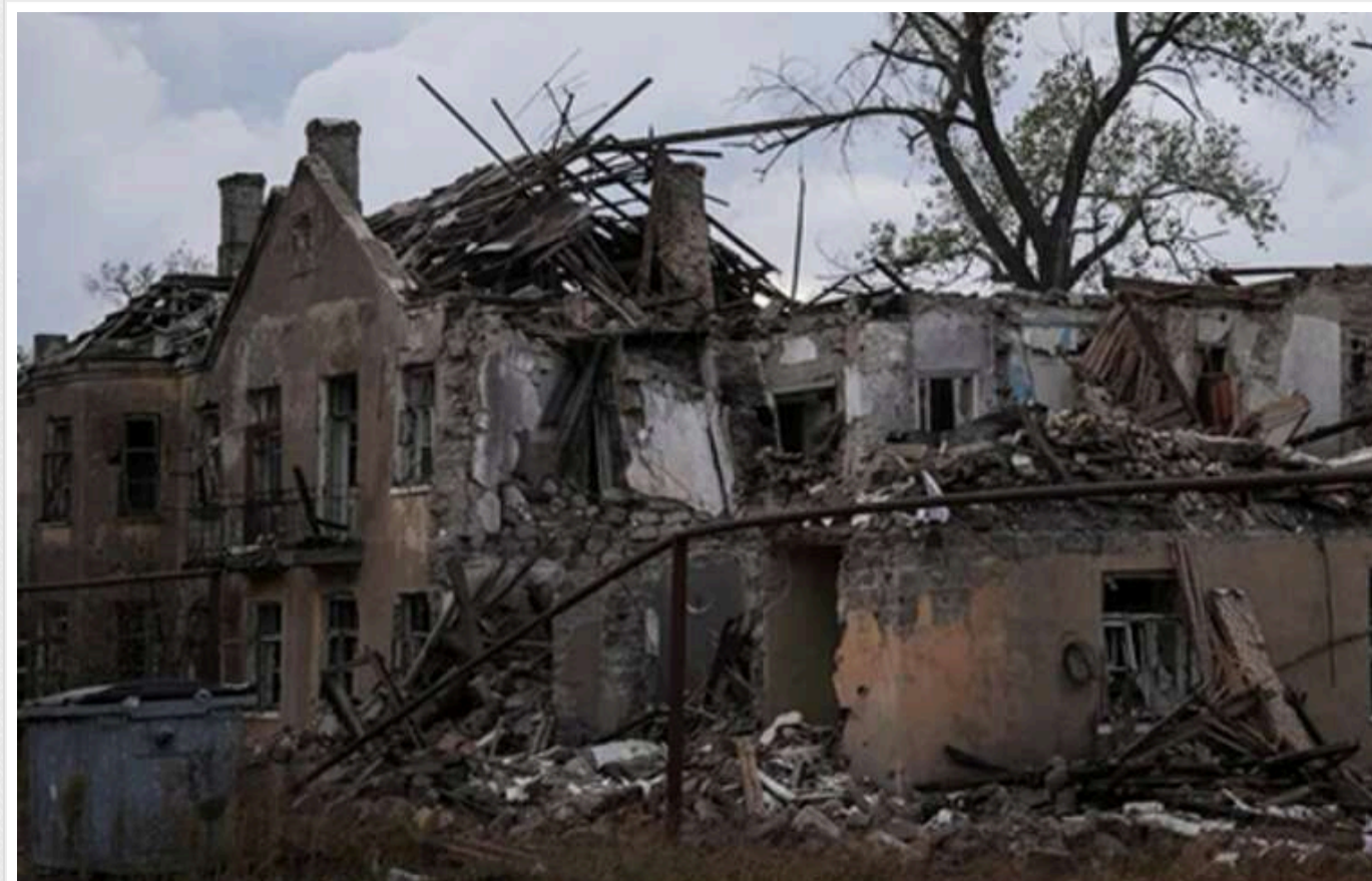
У ЗСУ повідомили про поточну ситуацію в районі Часового Яру та стан траси на Костянтинівку

Російські війська намагаються просунутися в районі Часового Яру. Особливо це стосується траси на Костянтинівку.