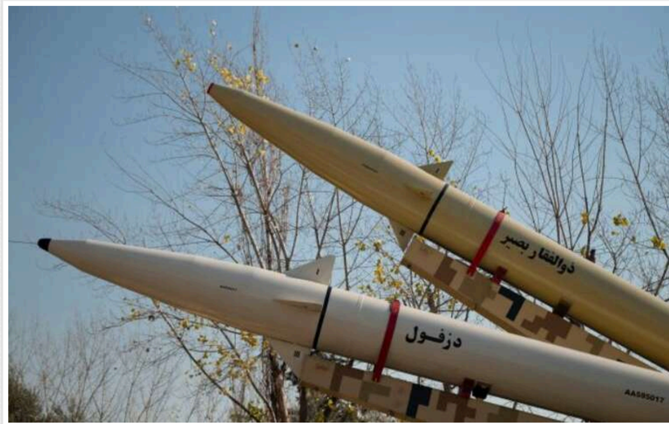
Іран має намір завдати удару по Ізраїлю балістичними ракетами та дронами з території Іраку, - ЗМІ

Іран, ймовірно, планує найближчими днями здійснити атаку на Ізраїль за допомогою балістичних ракет і дронів. Удар планується здійснити з території Іраку.