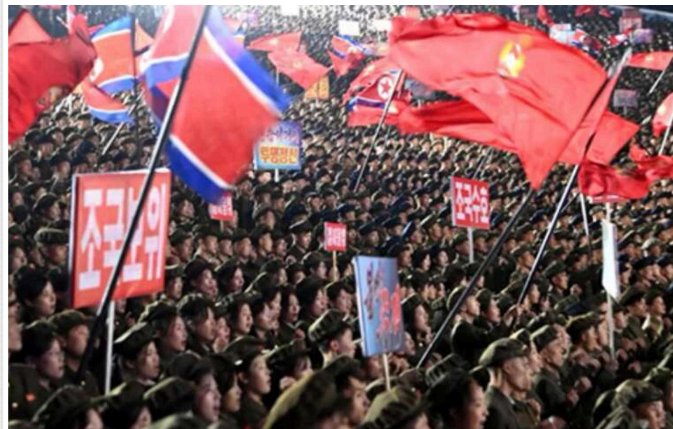
Військові КНДР уже прибули в окупований Донецьк, – ЦПД

Росія вже передислокувала інженерні війська Північної Кореї на тимчасово окуповані території України.