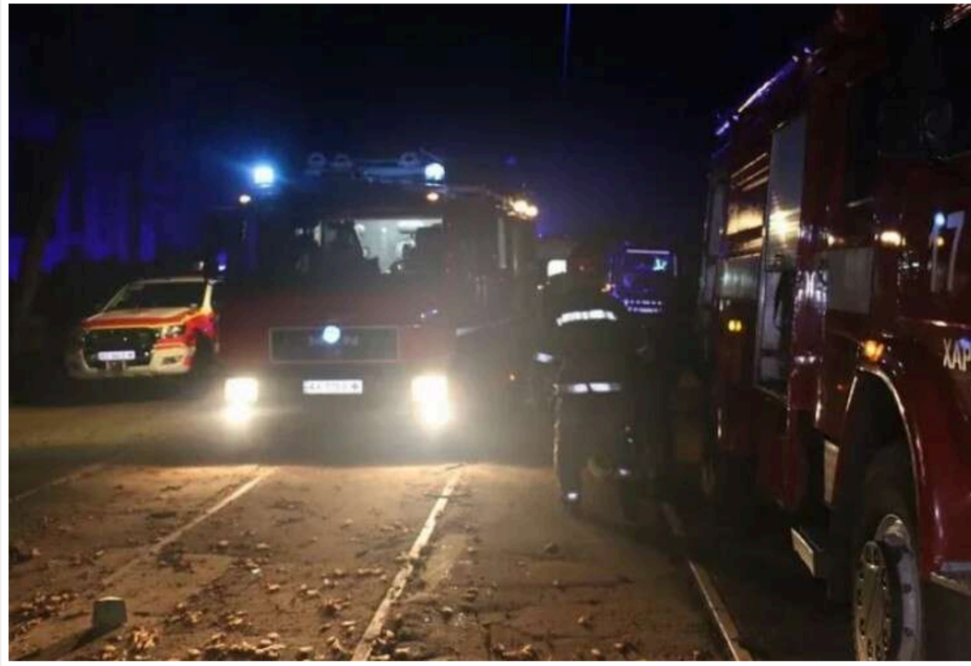
Окупанти завдали удару КАБами по Харківській області та Харкову

У Харкові ввечері 31 жовтня знову пролунали вибухи. Російські окупанти завдали авіаударів по місту. Зокрема, на Харків було скинуто керовані авіабомби.