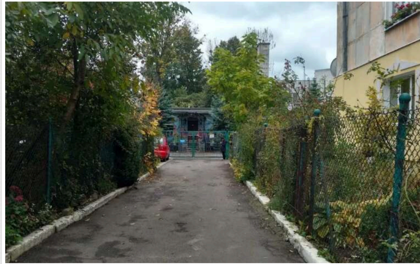
У Львові в притулку евакуйованих дітей із Запорізької області зачиняли в ізоляторі на 5 днів

Омбудсмен Дмитро Лубінець заявив, що у дитячому притулку Служби у справах дітей Львівської ОВА виявили ряд порушень прав вихованців. Зокрема, за різні порушення дітей відправляють в ізолятор, а медичні працівники, які працюють у притулку, не мають відповідної ліцензії.