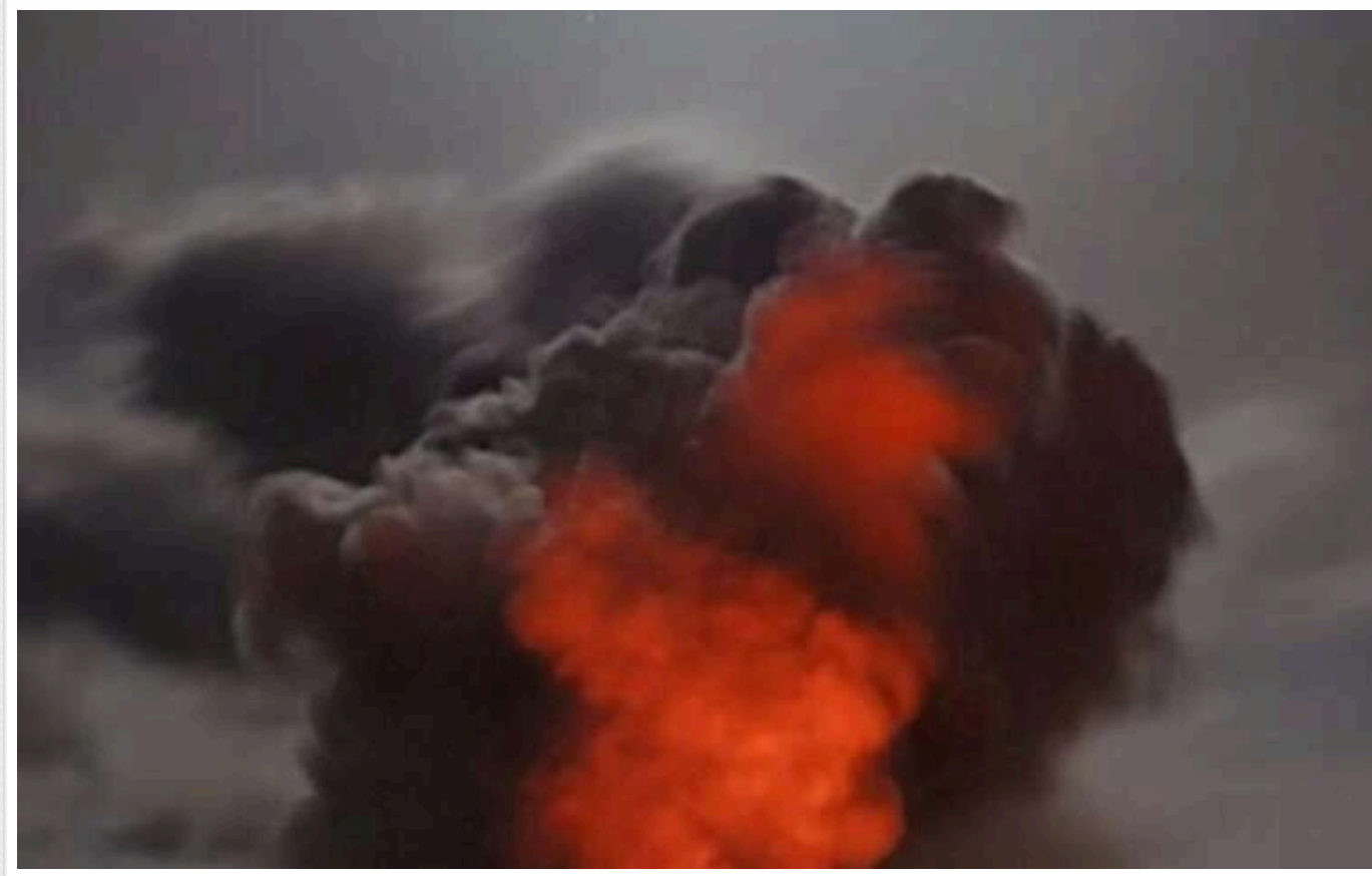
Росіяни знову атакують Харків: у місті лунають вибухи

У Харкові ввечері 31 жовтня пролунали вибухи. Російські терористи атакують місто.