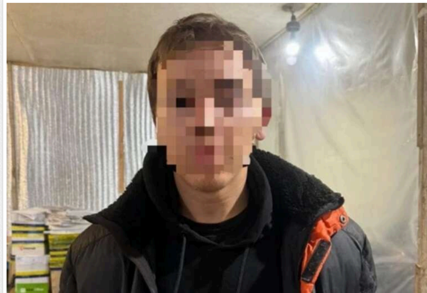
На Харківщині померла дівчина, яку побив, зґвалтував і намагався спалити її сусід-підліток

На Харківщині, після понад десяти днів боротьби за життя у реанімації, померла 15-річна дівчина, яку побив, зґвалтував та намагався спалити 17-річний сусід.