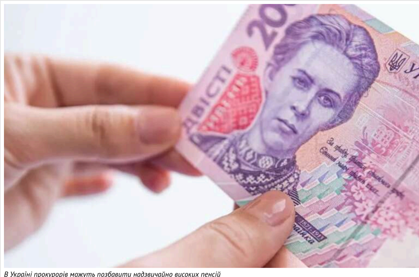
В Україні прокурорів можуть позбавити надзвичайно високих пенсій

Українські прокурори можуть залишитися без великих пенсій. Це відбудеться, якщо в Україні приймуть рішення про встановлення єдиних умов для перерахунку пенсій, незалежно від закону, за яким їх обчислюють.