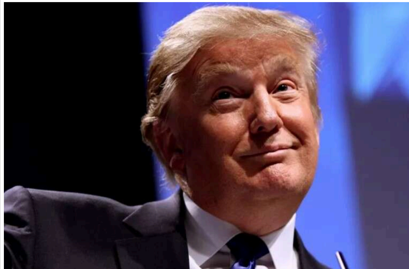
Трамп напередодні виборів у США збіднів на 1,3 мільярда доларів

Компанія Trump Media & Technology Group, що належить кандидату в президенти США від Республіканської партії Дональду Трампу, за добу втратила 1,3 млрд доларів ринкової капіталізації. Це стало найгіршим показником для компанії з часу її заснування.