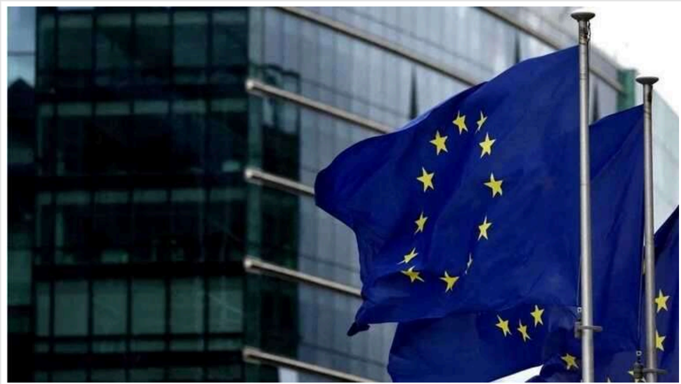
Politico: Єврокомісія хоче використати заморожені активи Кремля для захисту від РФ у судах

Європейська комісія розглядає можливість надати дозвіл Euroclear використовувати частину заморожених російських активів (192 млрд євро) для забезпечення кредиту для України на 45 млрд євро. Таке рішення може сприяти покриттю юридичних витрат і зменшенню фінансового навантаження на ЄС, проте воно вимагає схвалення всіх 27 країн-членів.