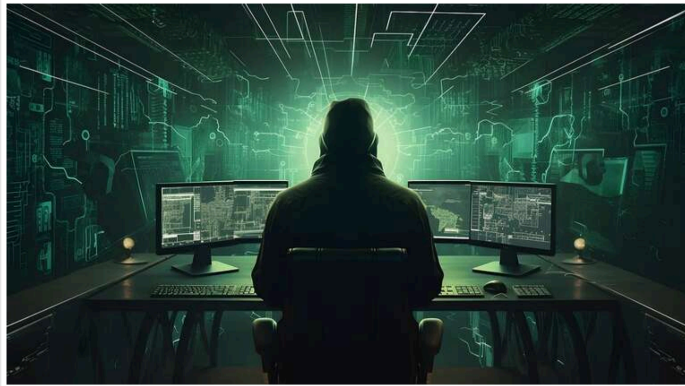
Першим пунктом внутрішньої стратегії ведення війни Зеленського - стала боротьба з дезінформацією