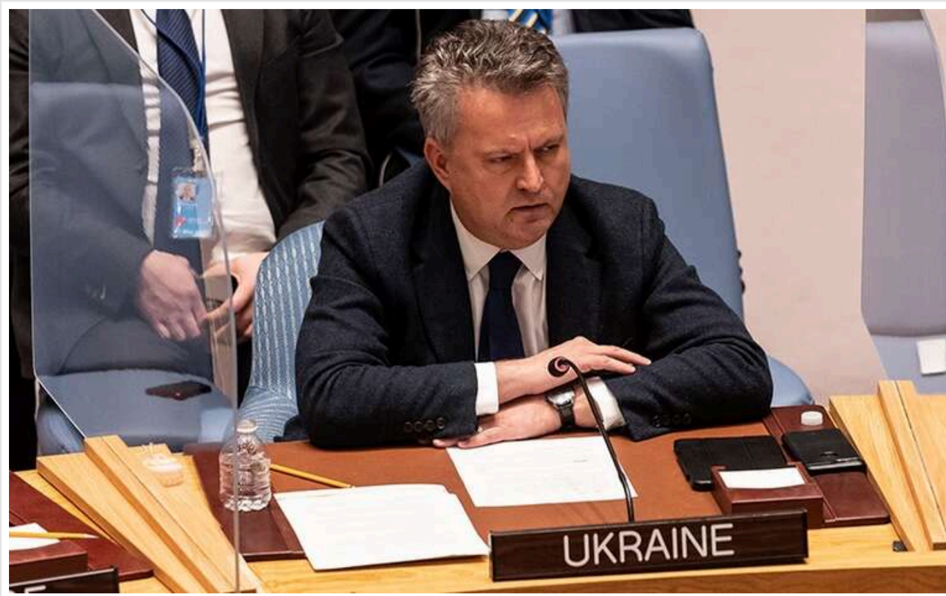
Військовослужбовці КНДР почнуть безпосередньо брати участь у бойових діях проти українських сил у листопаді

За доступними даними, у листопаді 2024 року військовослужбовці КНДР почнуть безпосередньо брати участь у бойових діях проти українських Сил оборони, повідомив постійний представник України при ООН Сергій Кислиця на засіданні Ради Безпеки ООН.