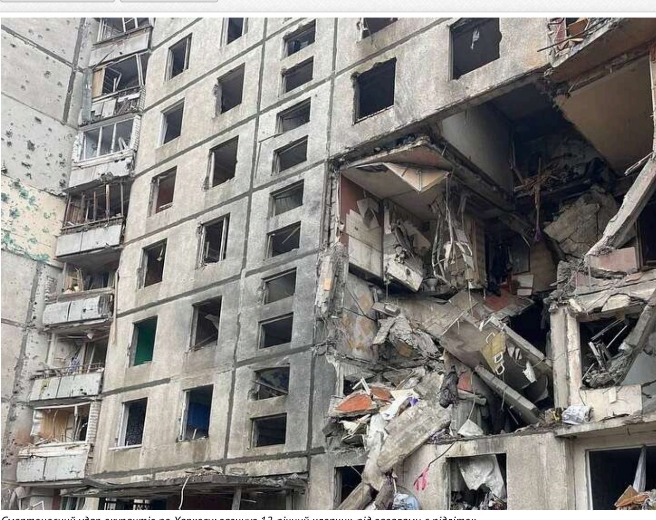
Смертосносний удар окупантів по Харкову: загинув 12-річний хлопчик, під завалами є підліток

У Харкові внаслідок удару, який російські окупанти завдали по житловій базатоповерхівці, загинув хлопчик, якому у вересні виповнилося 12 років.