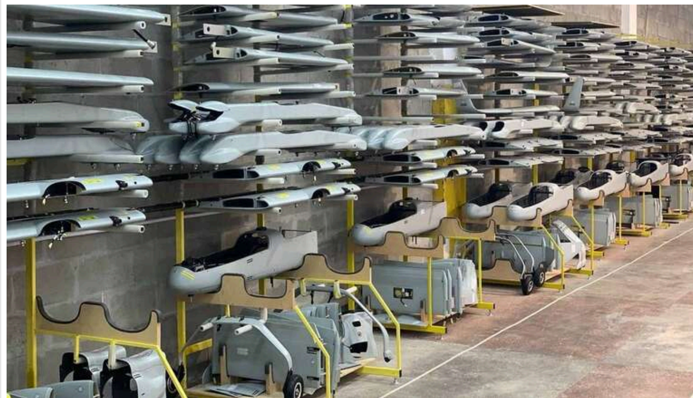
Чому досі не названі та не покарані керівники Генштабу, які злили ворогу дані щодо виробників БПЛА та боєприпасів?

У 2023-му році Головне управління безпілотних систем Генштабу ЗСУ, підготувало презентацію - усі основні типи дронів, які виробляються для сил оборони України, усі типи боєприпасів, усі виробники дронів та боєприпасів, реальні реквізити, адреси, назви компаній, і навіть реальні телефони та реальні імена керівників. Тобто уся структура галузі дронів в одній презентації.