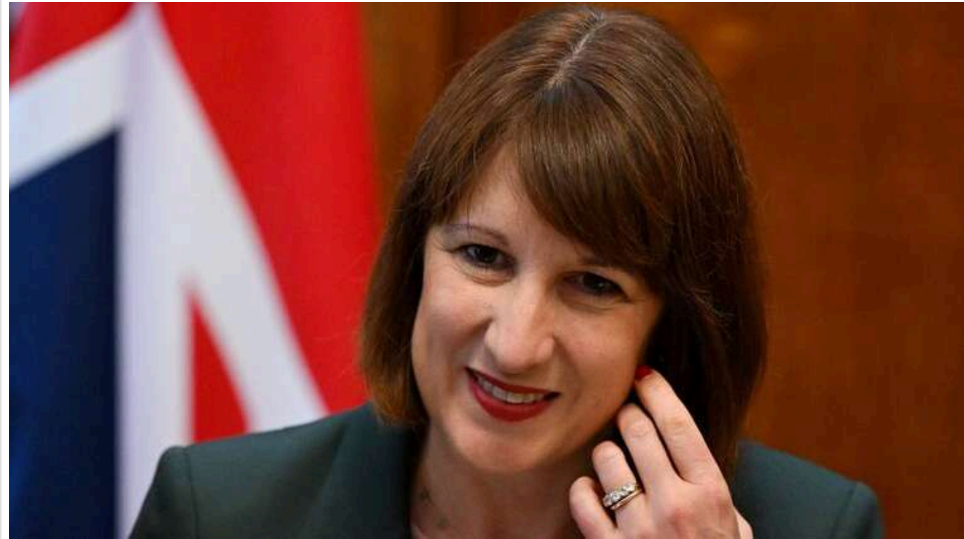
Велика Британія обіцяє щороку виділяти 3 мільярди фунтів стерлінгів на підтримку України

Про це заявила міністерка фінансів Великої Британії Рейчел Рівз.