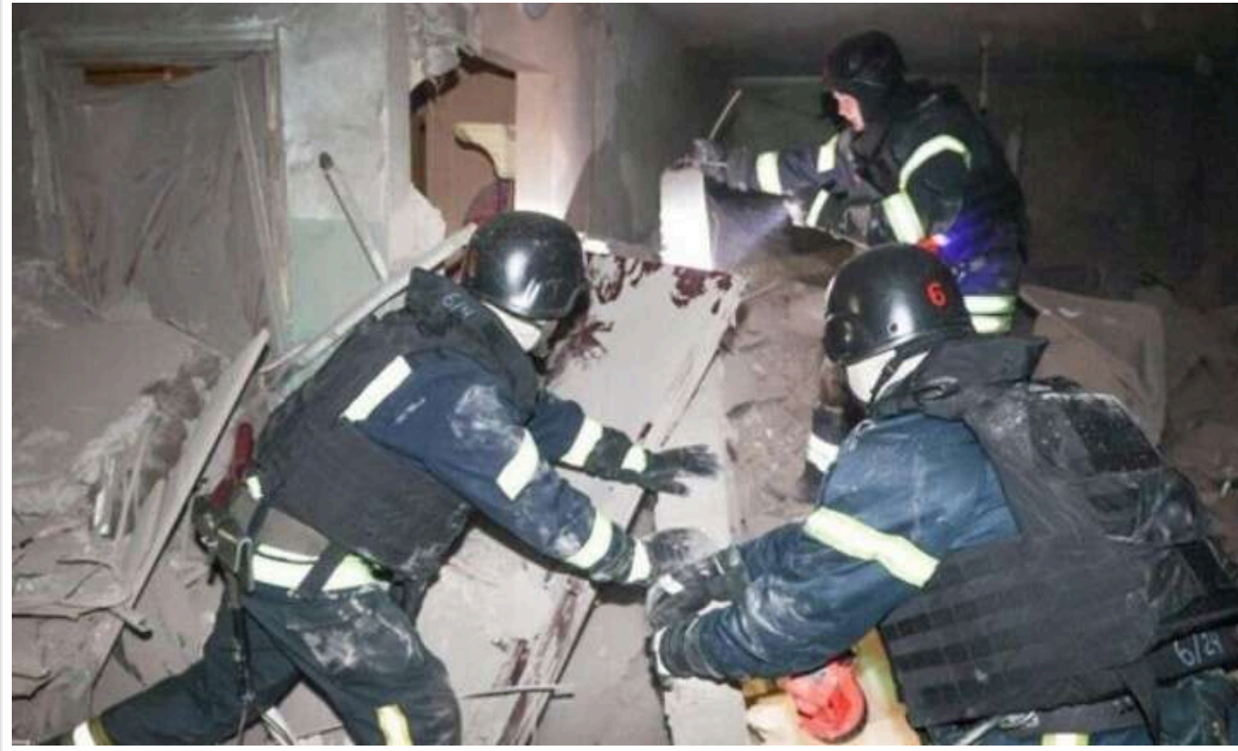
У Харкові під завалами знаходиться щонайменше троє людей, серед них є дитина

Про це повідомляє голова Харківської ОВА Олег Синегубов.