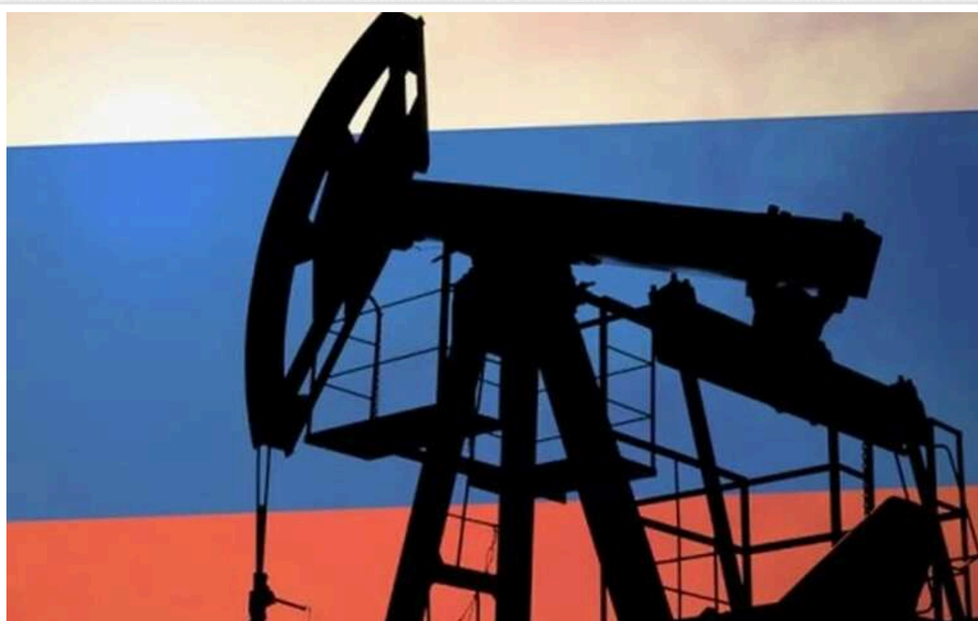
Ефективність західних санкцій на російську нафту з кожним днем зменшується, а їх посилення може завдати шкоди світовій економіці, - ЗМІ

Про це повідомляє французька газета Le Monde.