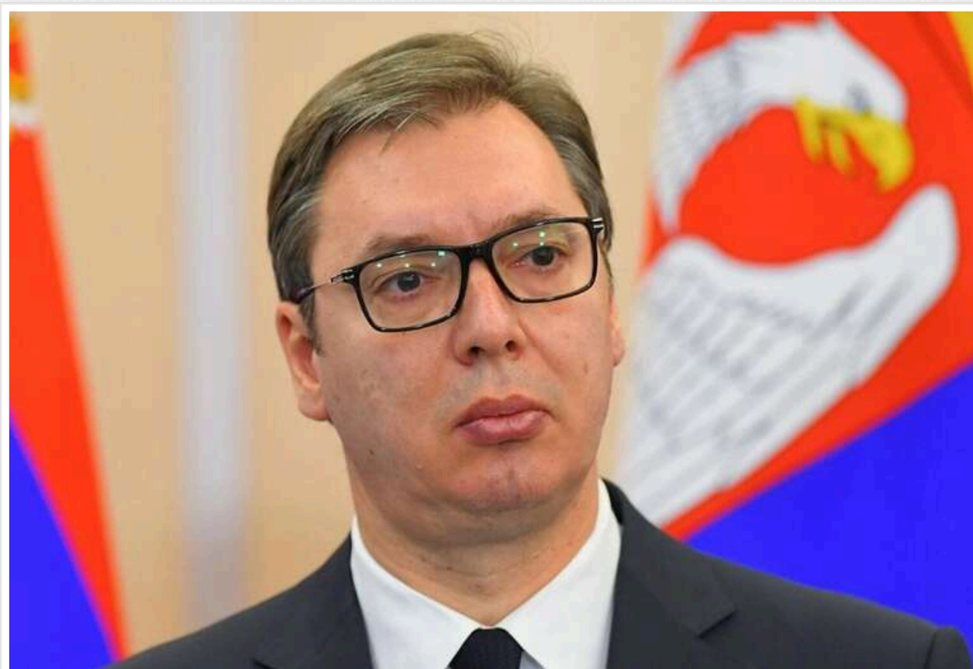
Президент Сербії Вучич говорив із Путіним про можливість припинення вогню в Україні під час телефонної розмови в жовтні

Проте російський президент не проявив інтересу до цієї ідеї.