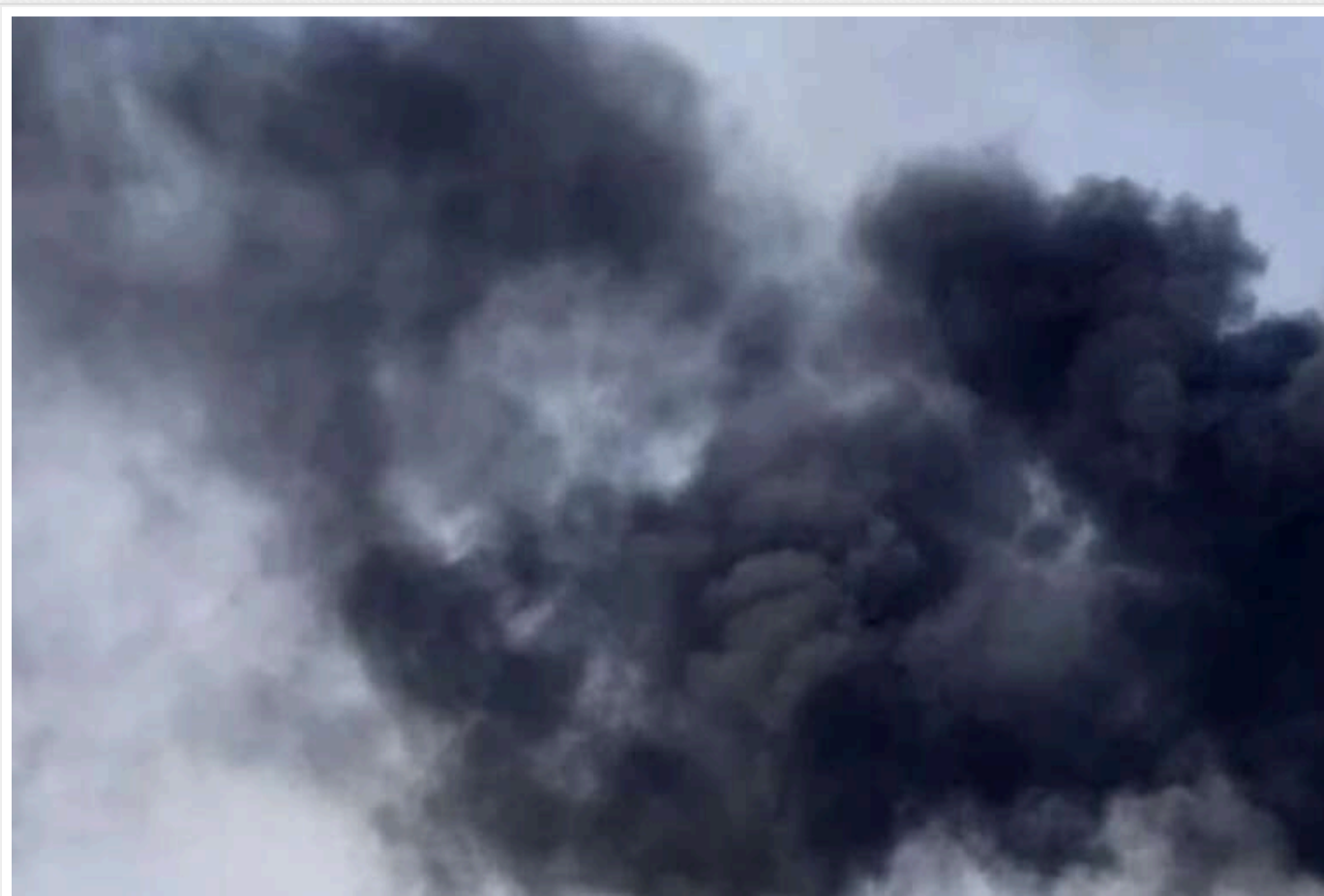
Окупанти завдали удару по Дніпру: постраждав підліток

30 жовтня ввечері російські терористи завдали удару по Дніпру. Унаслідок обстрілу постраждав підліток, якому 14 років.