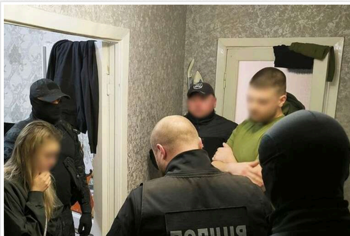
У Прилуках поліцейські ліквідували злочинну групу, яка займалася розповсюдженням наркотиків

Слідчі обласної поліції за матеріалами Департаменту внутрішньої безпеки Нацполіції України викрили систематичну діяльність жителів м. Прилуки з незаконного розповсюдження наркотичних засобів по всій Україні. Зловмисників взято під варту, їм пред'явлено підозри.