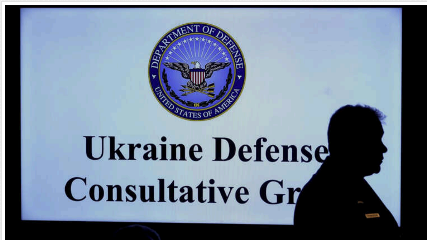
Зеленський анонсував нове засідання у форматі "Рамштайн"

Для досягнення миру Україна пропонує лише ті ідеї, які дійсно сприятимуть цьому. Вже відомо про контури зустрічі у форматі "Рамштайн".