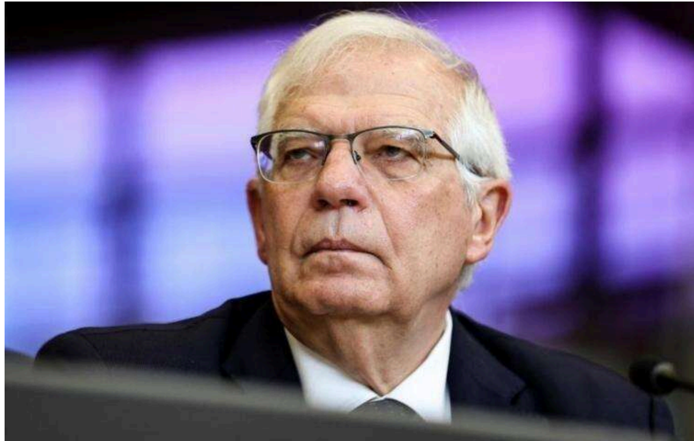
Євросоюз визначив для Грузії умови для повернення на європейський шлях

Грузії необхідно реалізувати кілька умов для повернення на європейський шлях. Для цього потрібна політична воля з боку влади країни.