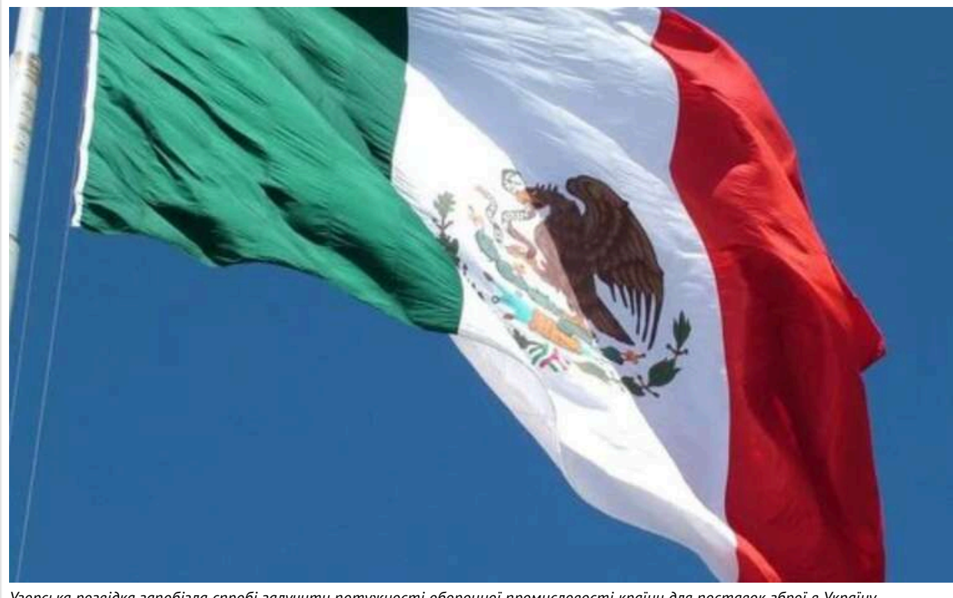
Угорська розвідка запобігла спробі залучити потужності оборонної промисловості країни для поставок зброї в Україну

Про це повідомив керівник адміністрації Орбана Гергей Гуйяш, згідно з інформацією Magyar Nemzet.