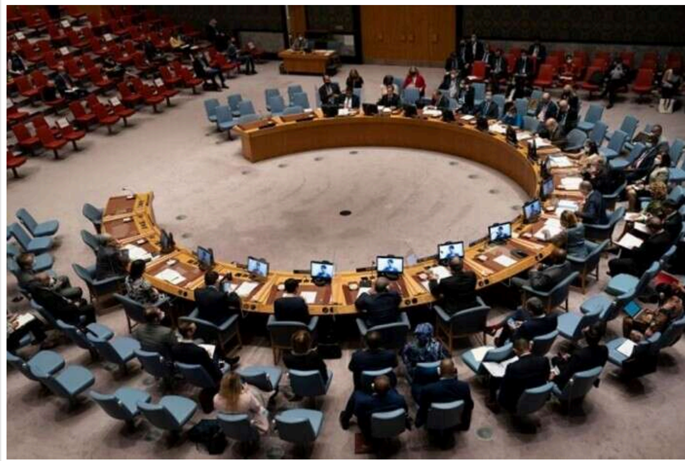
Україна ініціювала засідання Радбезу ООН через залучення військ КНДР до війни

Рада Безпеки ООН збереться для обговорення розгортання північнокорейських військових сил на фронті. Засідання заплановано на сьогодні, 30 жовтня.