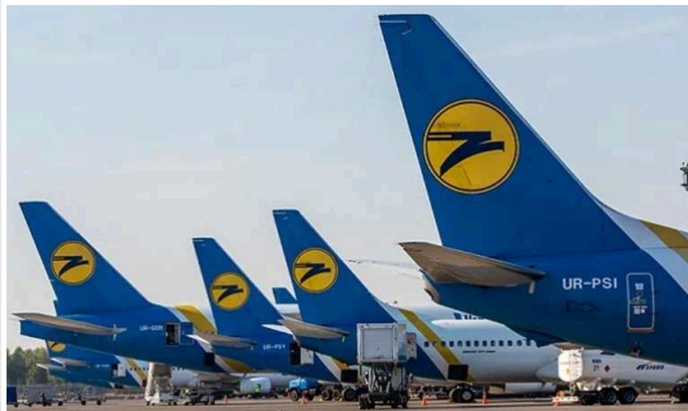
Державіаслужба без обґрунтування витратила 666 тисяч гривень на премії керівництву

Попри невиконання керівництвом Державіаслужби деяких завдань і обов'язків, були призначені надбавки за інтенсивність у розмірі 250-500% посадового окладу, що спричинило до неекономного використання 666,3 тис. гривень бюджетних коштів.