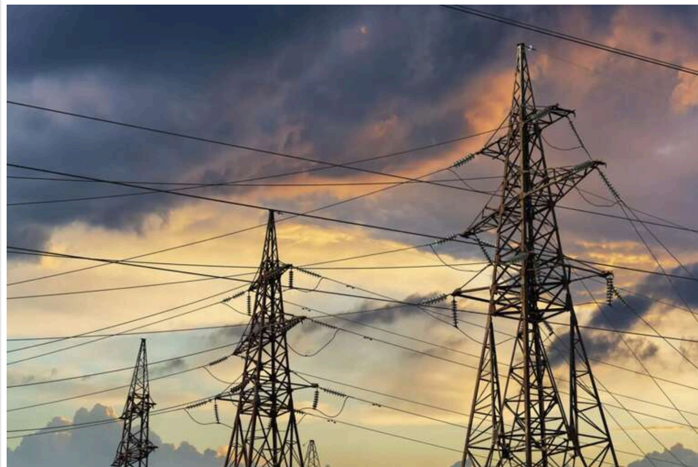
З першого листопада обсяг імпорту електроенергії потенційно збільшиться до 2,1 ГВт, – нардеп

Він зазначає, що енергетична ситуація на 90% залежить від надійності систем протиповітряної оборони, і за відсутності серйозних пошкоджень дефіциту не буде.