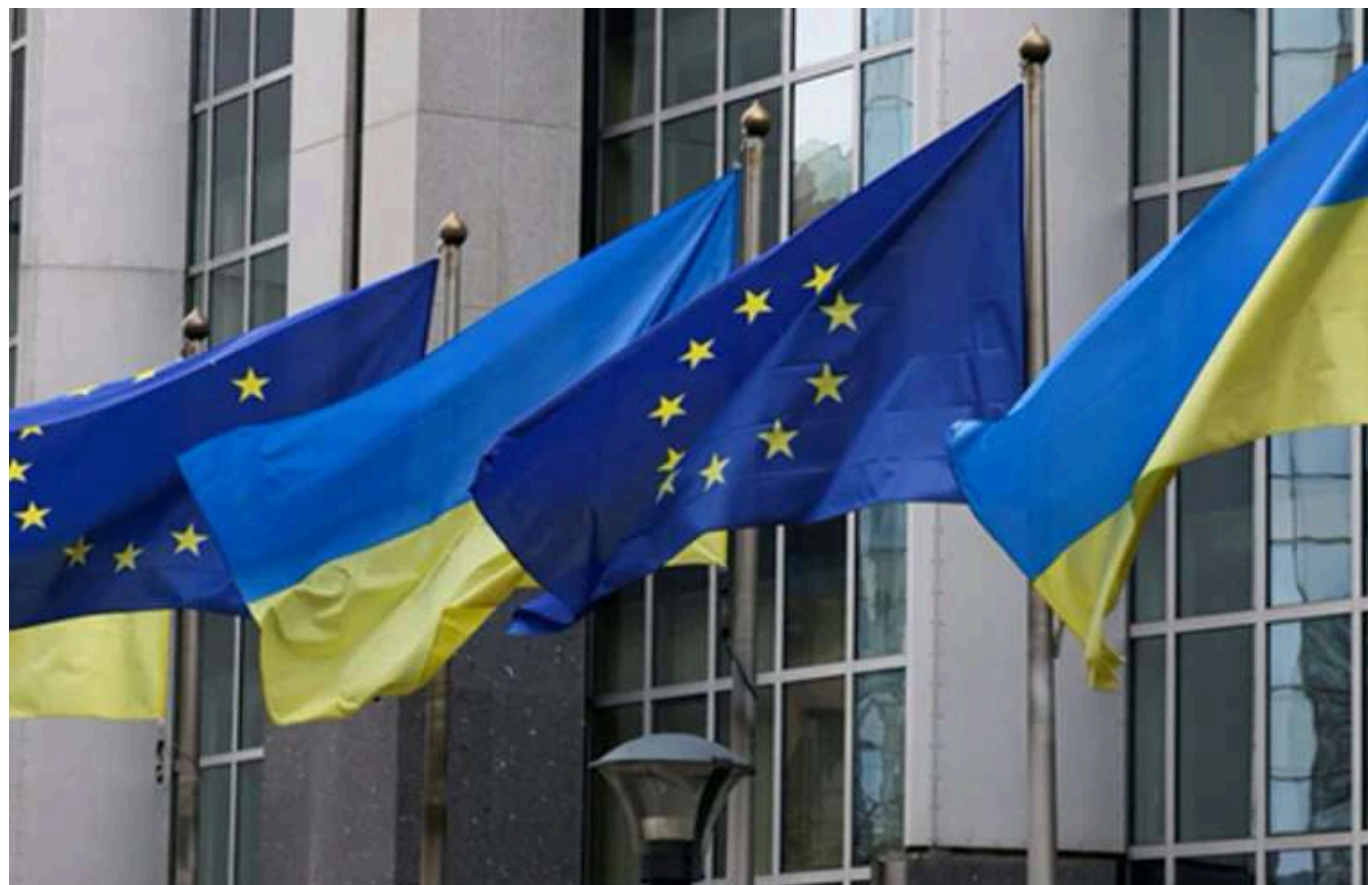
Україна має посилити боротьбу з корупцією на високому рівні та з організованою злочинністю, - звіт Єврокомісії з розширення ЄС

У висновках документа зазначено: попри прогрес у фундаментальних реформах, Україні «необхідні подальші зусилля».