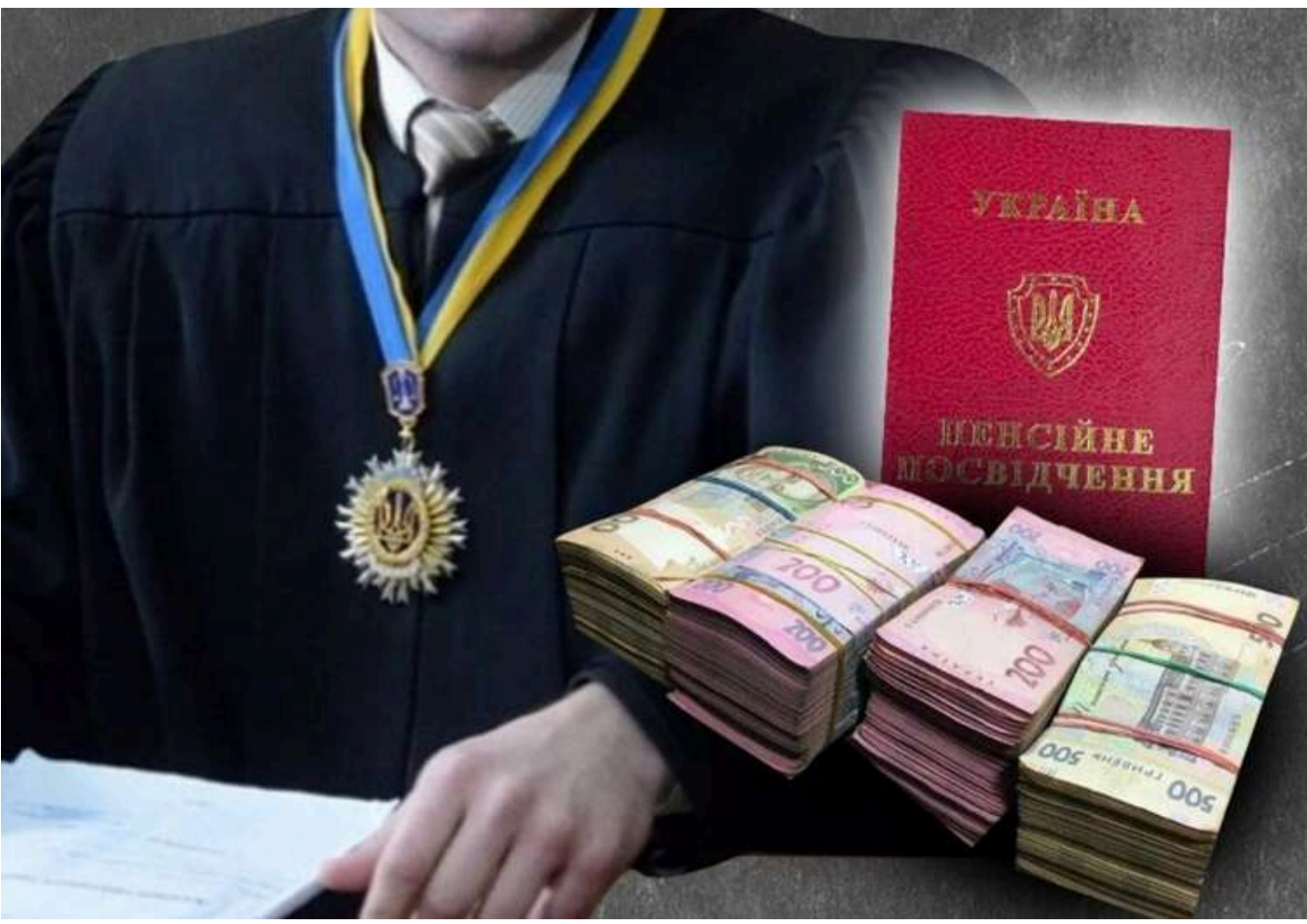
Як судді та прокурори, які мають дотримуватись закону, обминають його, щоб залізити в кишені українців

Скандал навколо прокурорів, які отримали статус осіб з інвалідністю, вже призвів до рішення про ліквідацію медико-соціальних експертних комісій (МСЕК) і відставку генерального прокурора. Після внутрішніх перевірок з'ясувалося, що в окремих областях понад чверть прокурорів є особами з інвалідністю. Принаймні, офіційно.