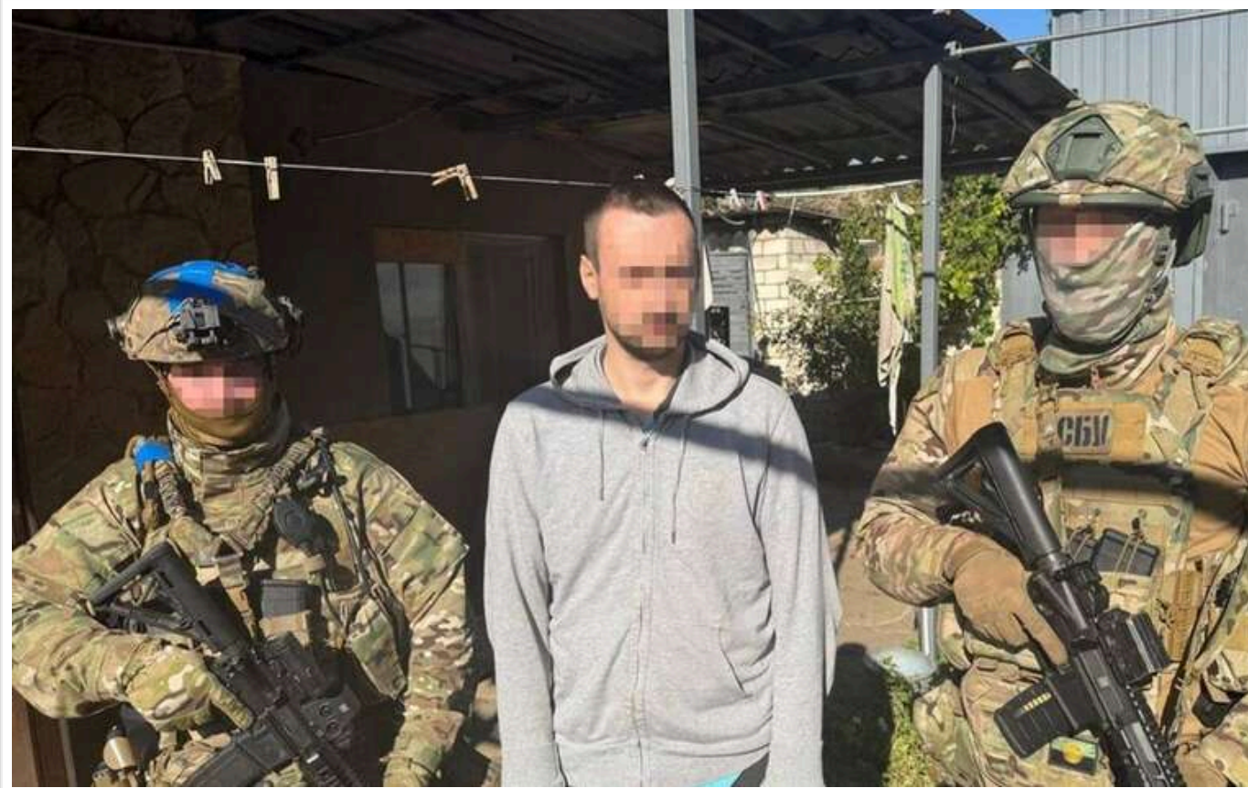
СБУ затримала чотирьох ймовірних агентів російських спецслужб: "Наводили російські КАБи на оборонців Донецчини"

Служба безпеки затримала ще чотирьох ймовірних агентів російських спецслужб, яких підозрюють у коригуванні російських ударів по Донецчнині.