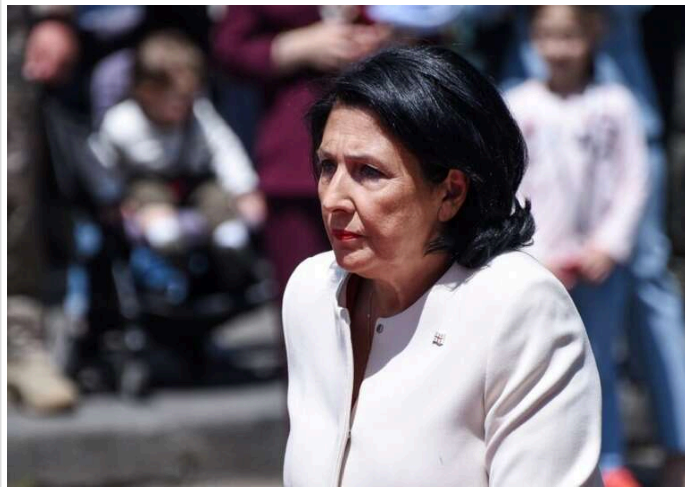
Прокуратура Грузії викликала президентку Зурабішвілі на допит

У Грузії почали розслідування через можливі фальсифікації на парламентських виборах. У зв'язку з цим президентку Саломе Зурабішвілі викликали на допит.