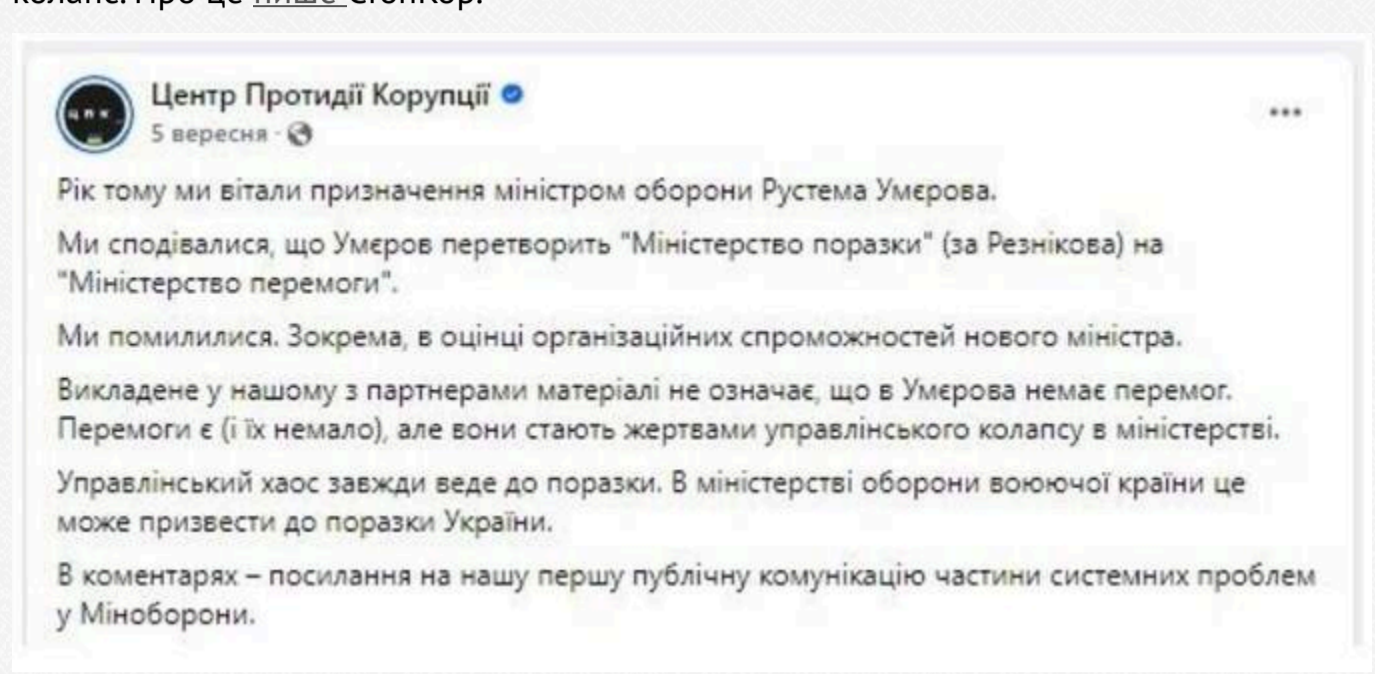
Клан «смотрящего» по Запоріжжю Давітяна в тилу: Як Умеров заводить у МОУ родичів фігурантів корупційних справ

Після звільнення ексміністра оборони Олексія Резнікова, який оскардився в 30 мільйонів євро за закупівлю турецьких курток для українських військових з повною передачею в 30 мільйонів євро і ще по 17 гривень, на посаду міністра оборони України був призначений Рустем Умеров. Його широко представляли як ефективного управлінця. Але все частіше сьогодні Міністерство оборони України, очолюване Умеровим, називають «Міністерством хаосу». І от Центр протидії корупції на своїй сторінці у фейсбукі пояснив це тим, що у міністерстві на сьогодні відбувся управлінський колапс. Про це пише СтопКор.