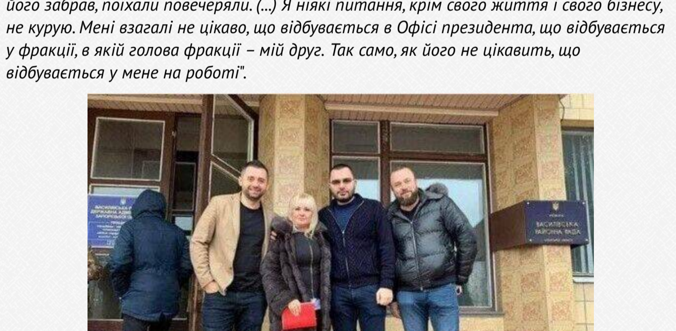
Клан «смотрящего» по Запоріжжю Давітяна в тилу: Як Умеров заводить у МОУ родичів фігурантів корупційних справ

Сам він пояснює це так: «Я домовлявся зустрітись з Давидом Арахамією, ми з ним один одного знаємо і дружимо багато років. Домовилися там (під ОП — ред.) зустрітись, в його забор, поїхати повечеряти, (...) Я ніякі питання, крім свого життя і свого бізнесу, не курю. Мені взагалі не цікаво, що відбувається в Офісі президента, що відбувається у фракції, в якій голова фракції — мій друг. Так само, як його не цікавить, що відбувається у мене на роботі».