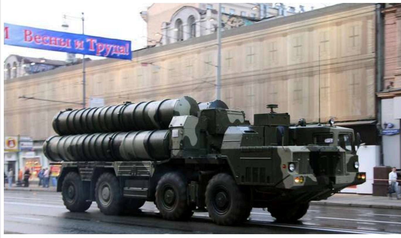
WSJ: Ізраїль під час атаки на Іран знищив усі системи ППО С-300, які надав Кремль

Авіаудари не тільки знищили важливу іранську військову інфраструктуру, але й завдали шкоди репутації російської військової техніки, повідомляє видання.