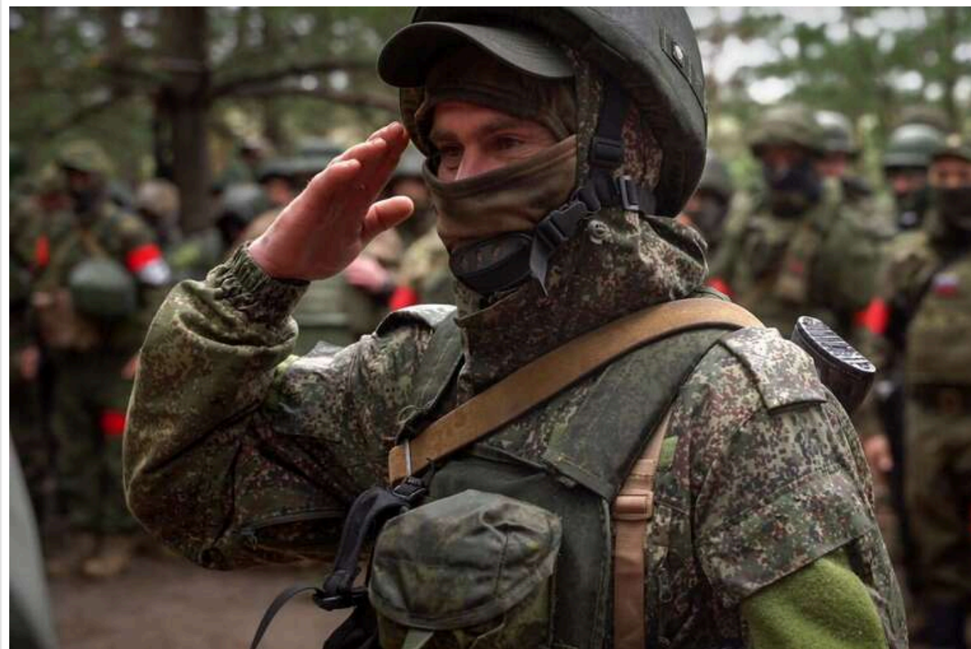
Окупанти продовжують наступ на Курахове з південно-західного напрямку, - DeepState

Російські війська продовжують наступ на Курахове з південно-західного напрямку, створюючи загрозу ізоляції міста від головної дороги.