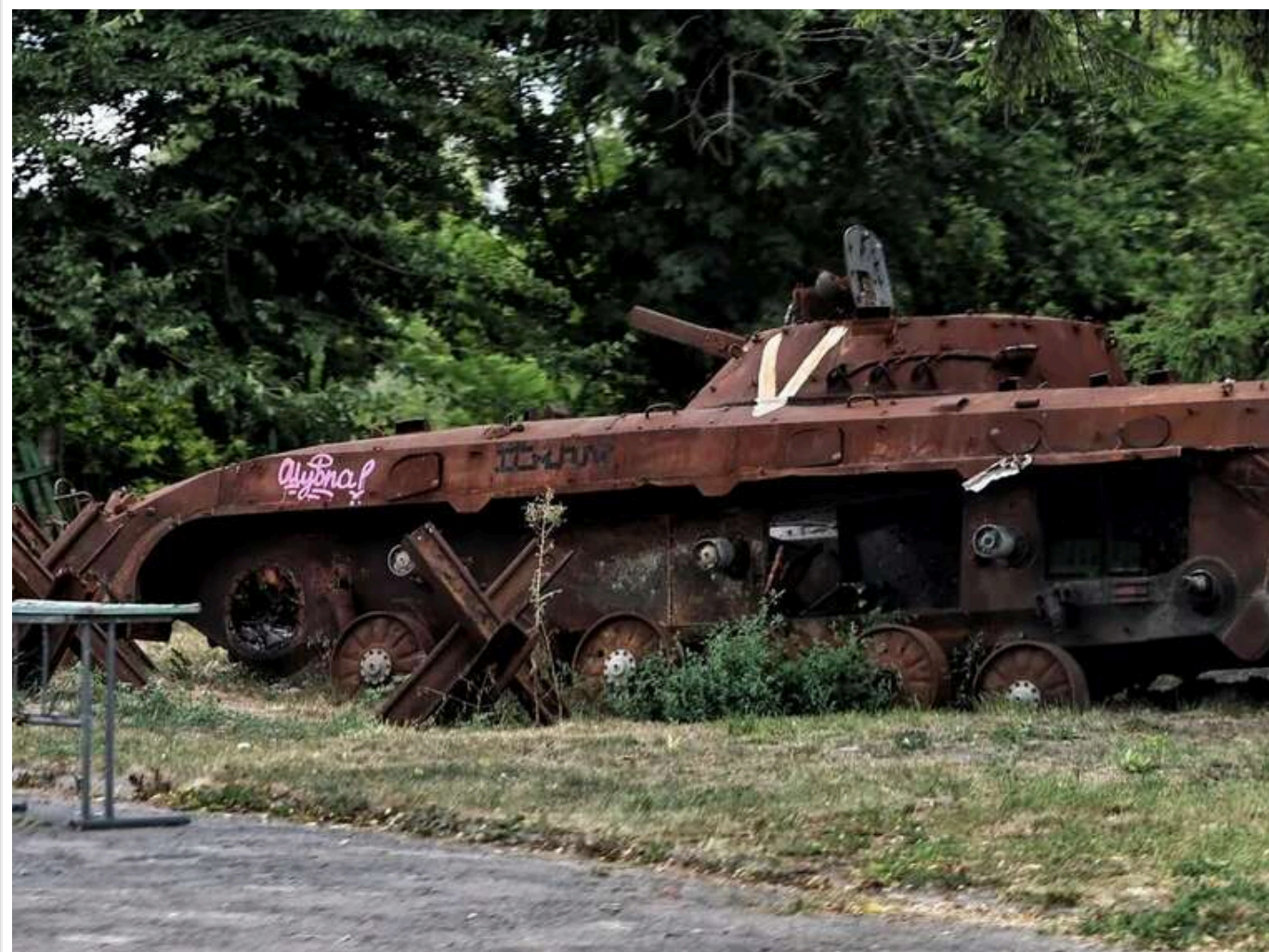
Втрати ворога за добу: Сили оборони відмінували понад 1,5 тис. окупантів, 8 танків і 38 артсистем

Українські захисники напередодні, 29 жовтня, знищили 1560 російських окупантів. Також армія російського диктатора Володимира Путіна втратила 210 одиниць військової техніки та озброєнь.