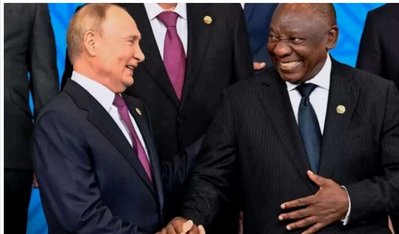
У ПАР розгорівся скандал після поїздки президента на саміт до Путіна

Відносини з Путіним призвели до розколу в уряді ПАР.