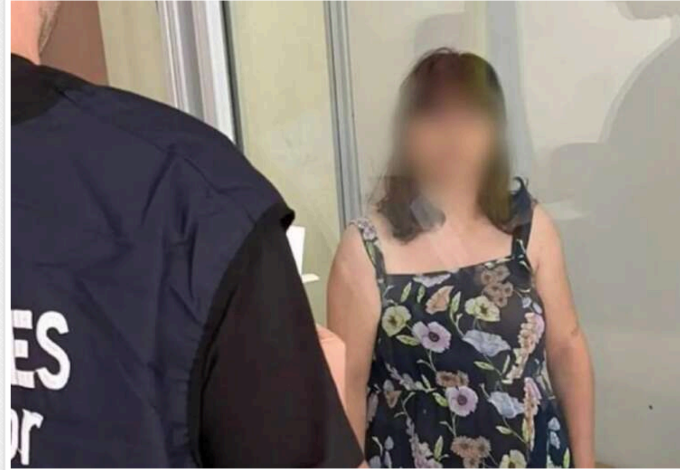
Коригувальниця ФСБ отримала 10 років в'язниці: наводила російські ракети на Харків

Коригувальниця ФСБ РФ, яка за допомогою селфі наводила російські ракети на Харків і на своє рідне село Довжик Богодухівського району, отримала десять років ув'язнення. Для маскування жінка видаляла файли після кожного сеансу зв'язку з ворожою спецслужбою та постійно змінювала телефони, але все одно була виявлена.