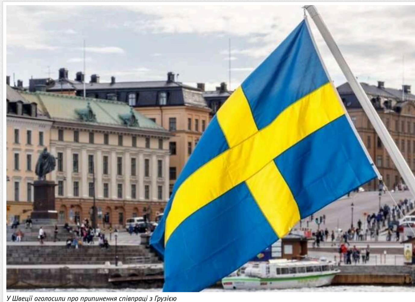
У Швеції оголосили про припинення співпраці з Грузією

Швеція зупинила всю пряму співпрацю з владою Грузії на урядовому рівні через обмеження для громадянського суспільства та недемократичні зміни в законодавстві. Однак, фінансування проєктів громадських організацій продовжуватиметься.