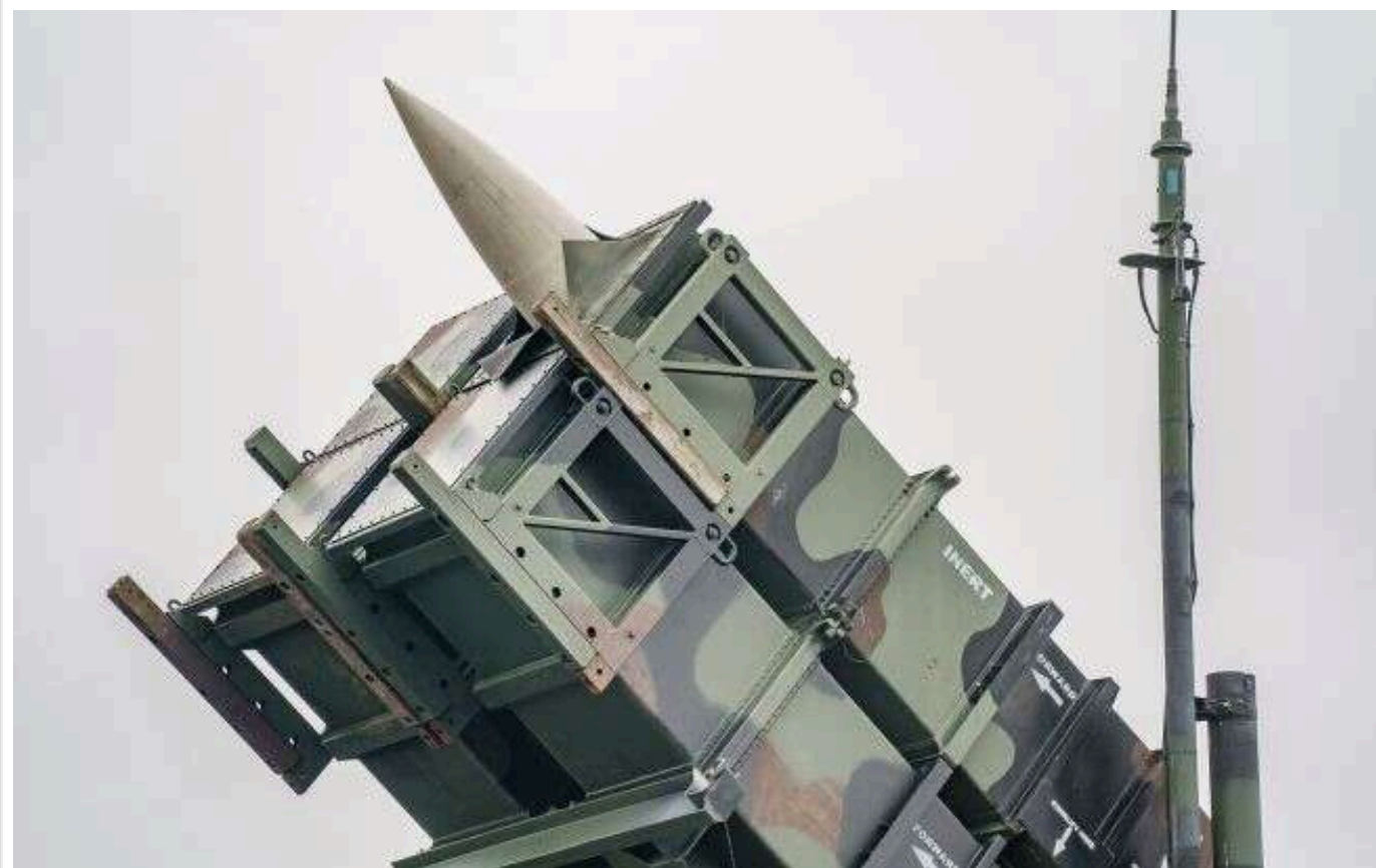
Норвегія надасть Україні майже 120 мільйонів євро на новий Patriot

Норвегія разом з іншими союзниками виділить близько 120 млн євро для України. Ці кошти необхідні для того, щоб Україна отримала ще одну систему Patriot від Румунії.