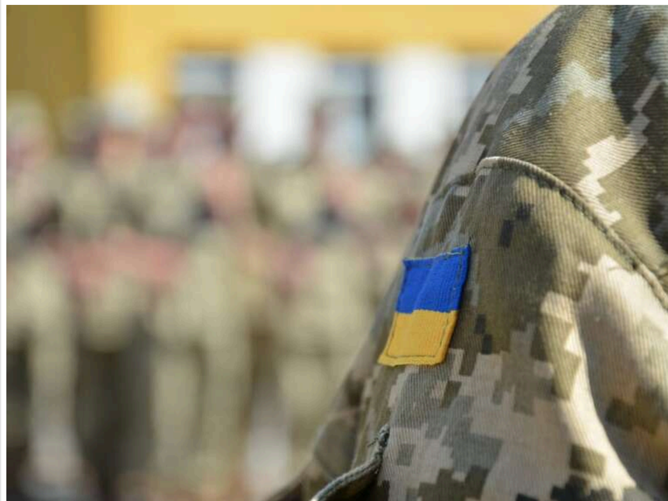
Мобілізація в Дніпрі: співробітники ТЦК намагалися силою зашхати в автобус чоловіка з ціпком

У мережі з'явилось відео силової мобілізації в Дніпрі.