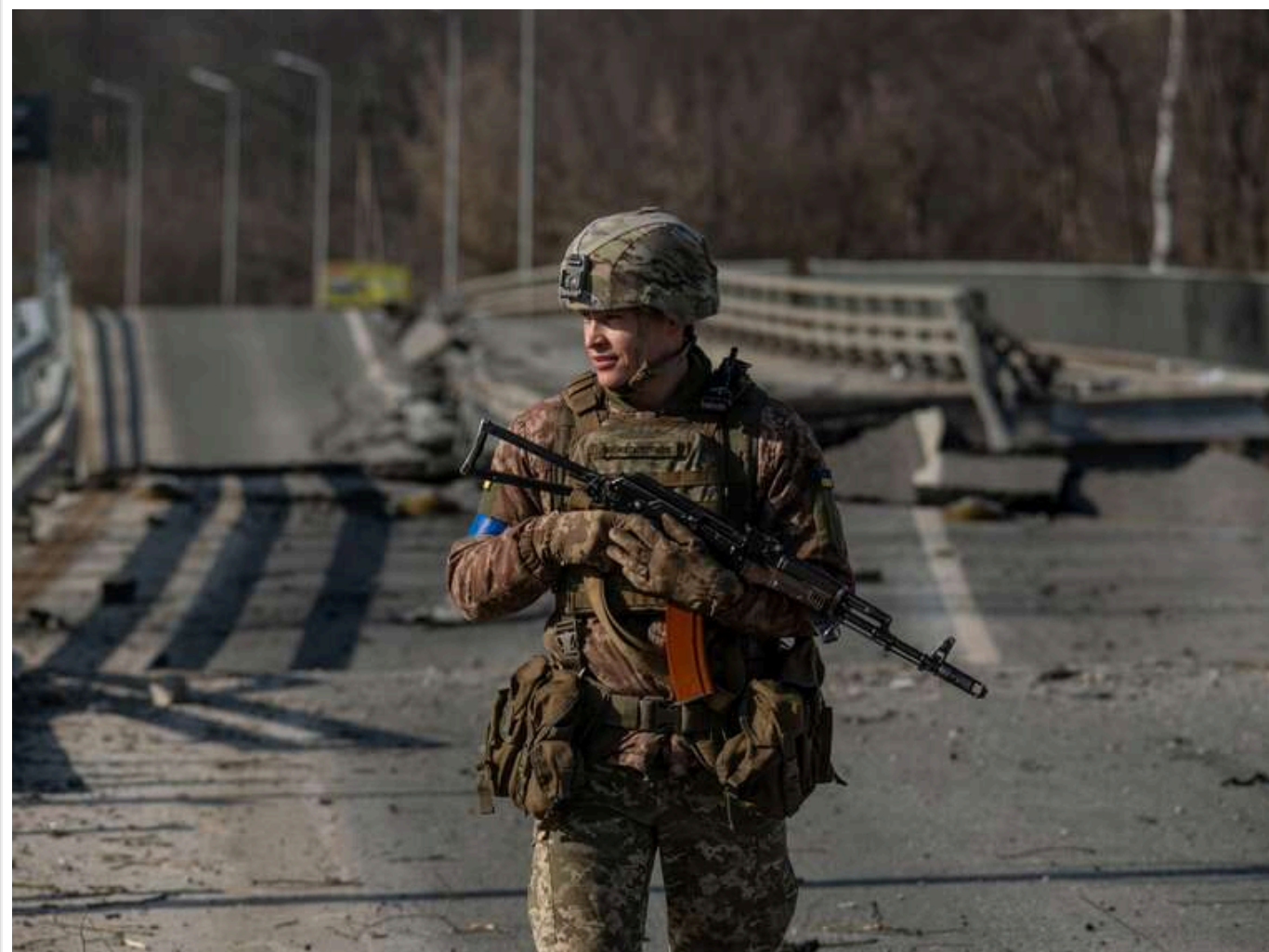
Окупанти прорвалися за Богоявленку та майже дійшли до Трудового, - військовий

Російські сили прорвалися за Богородичне в Донецькій області і майже досягли Трудового, як повідомив військовослужбовець ЗСУ з позивним «Тінь».