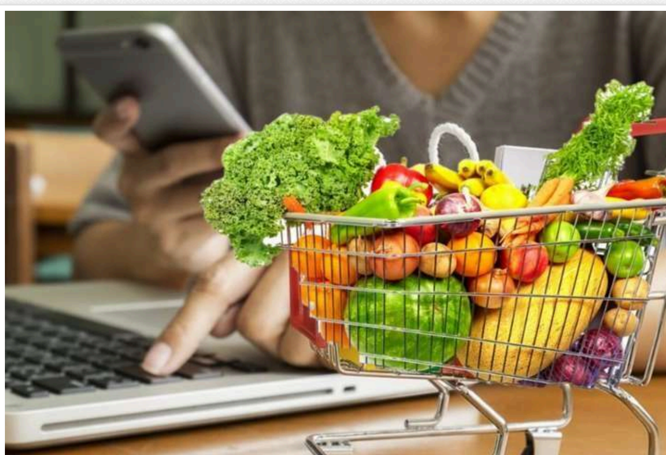
Українці попереджають про зростання цін на товари та послуги

З настанням осені ціни на споживчі товари та послуги знову різко зростає – у вересні зростання досягло 8,6% у річному вимірі. І це ще не кінець.