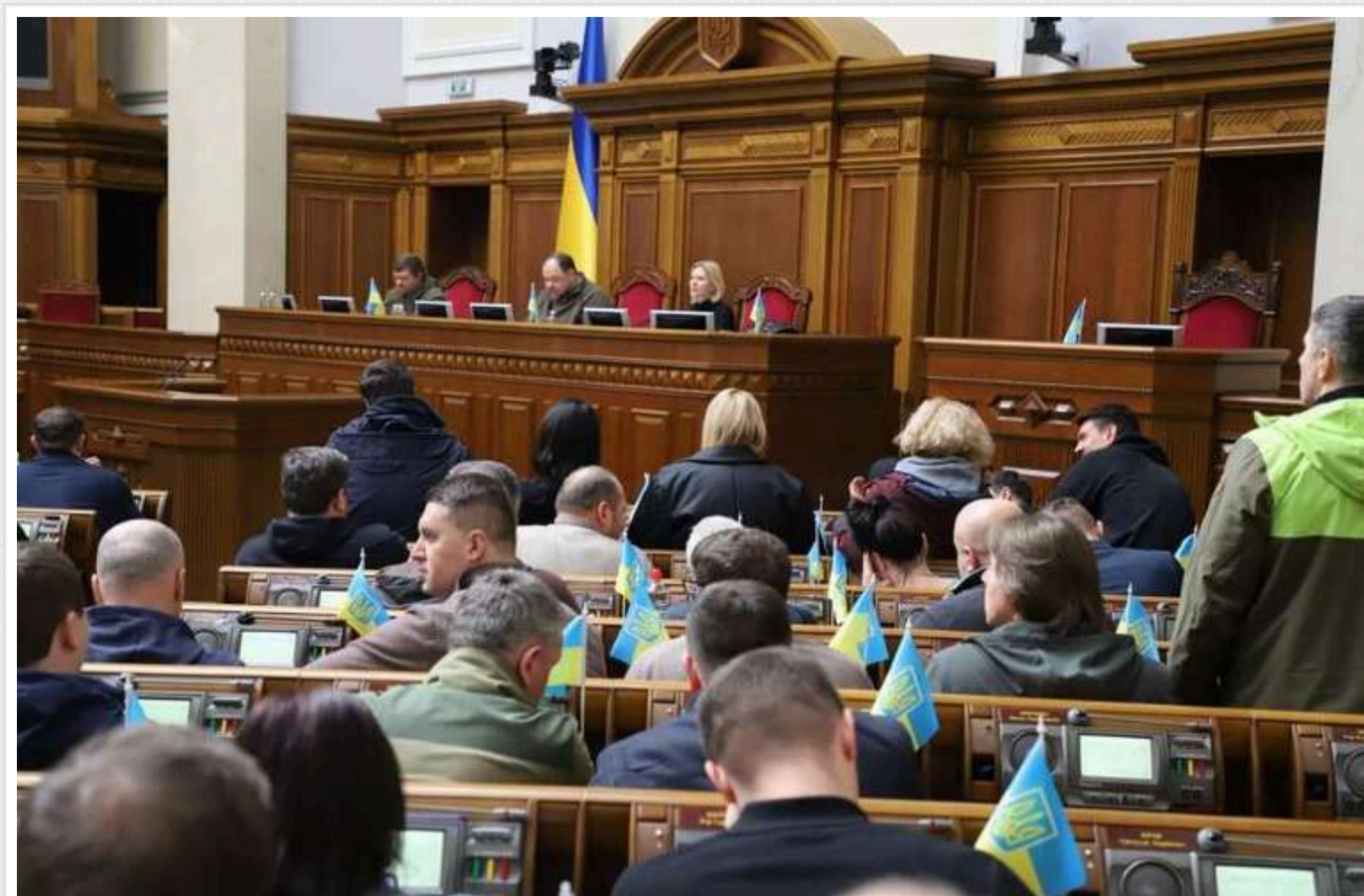
У Раді схвалили закон про угоди корупціонерів зі слідством

Верховна Рада України у вівторок, 29 жовтня, схвалила в цілому законопроект № 12039 про угоду з слідством по корупційних справах.