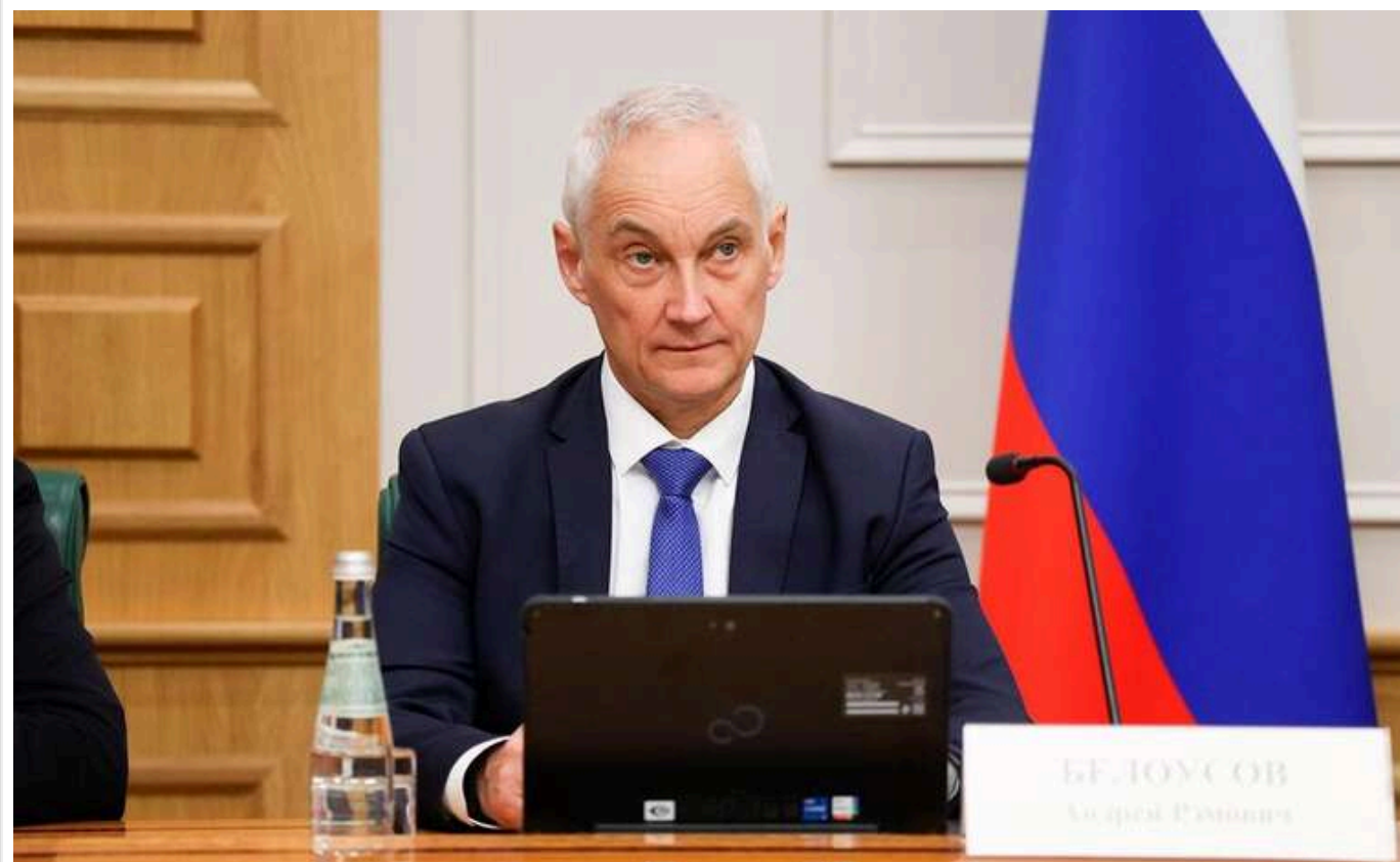
У Міноборони РФ заявили, що в ході навчань буде відпрацьовано масований ядерний удар у відповідь

Російські збройні сили, під керівництвом президента РФ Володимира Путіна, в рамках навчань здійснюють відпрацювання масованого ядерного удару стратегічними наступальними силами у відповідь на ядерний удар противника, повідомив міністр оборони РФ Андрій Белоусов.