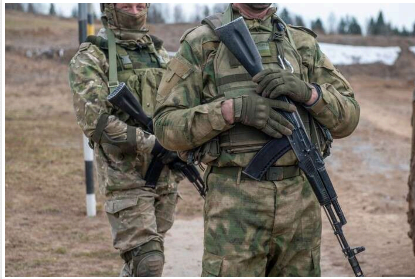
Окупанти захопили Ясну Полян у південній захід від Курахового, - військовий

Росіяни взяли під контроль Ясну Полян, розташовану на південній захід від Курахового, повідомляє військовослужбовець ЗСУ з позивним «Мучний».