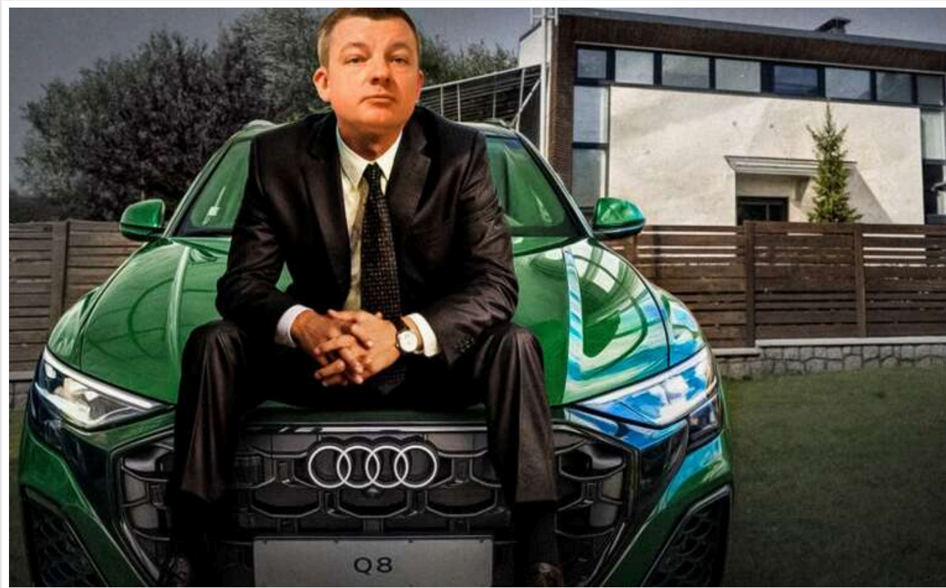
НАЗК перевіряє спосіб життя судді Дашутіна після розслідування журналістів

Національне агентство з питань запобігання корупції почало моніторинг способу життя судді Касаційного адміністративного суду у складі Верховного Суду Ігоря Дашутіна. Йдеться про користування елітним майном, яке важко пояснити офіційними доходами.