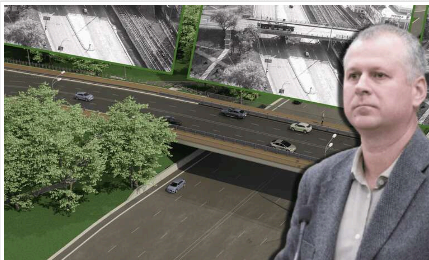
«Київавтодор» витратить 440 мільйонів гривень на реконструкцію мосту на Дарниці, передавши контракт своєму провідному підряднику

Реконструкція столичного шляхопроводу біля станції метро «Дарниця» стартувала з угоди на суму майже 440 млн гривень.