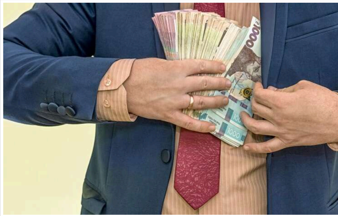
Українцям показали, кому з чиновників платять зарплати по 100 тисяч гривень на місяць

Згідно з даними Міністерства фінансів України, середня заробітна плата працівників державних установ у серпні 2024 року становила 55,8 тис. гривень. Це на 44% більше, ніж на початку року, попри незначне зменшення порівняно з липнем.