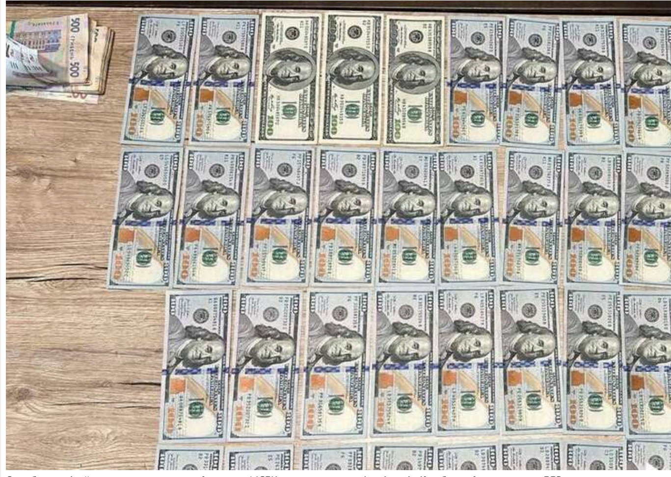
Заробляли мільйони на ухилинтах: в одеському МСЕК викрито групу лікарів, які підробляли документи, – ДБР

Група лікарів допомагала здоровим чоловікам призовного віку отримувати документи для визнання їх непридатними до служби за $6-$12 тисяч.